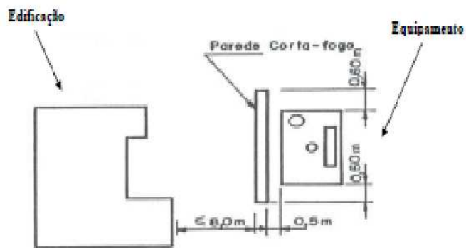
Figura 2 - Separação por parede corta-fogo